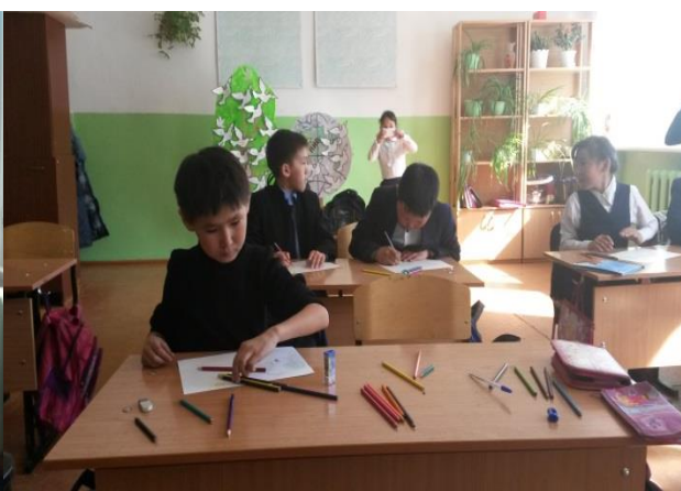
Методика «Дом. Дерево. Человек», и «Рисунок семьи».