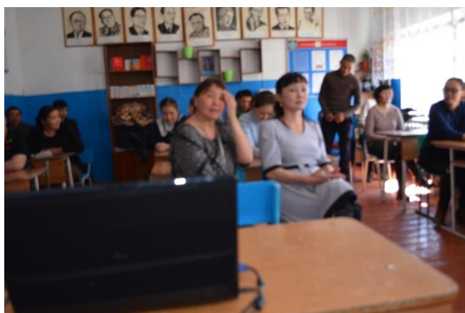
Собрание для родителей «Правила общения с подростками» МБОУ СОШ с. Моген-Бурен