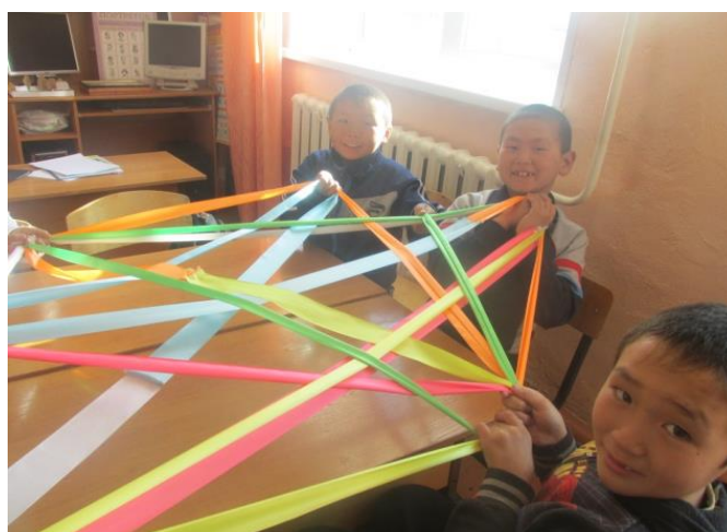
Тренинг общения Бай-Тайгинский кожуун