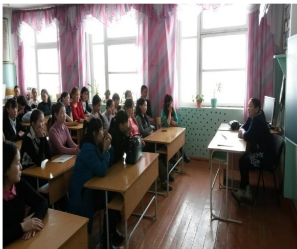
Классный час «Барьер непонимание» МБОУ СОШ №2 с. Мугур-Аксы