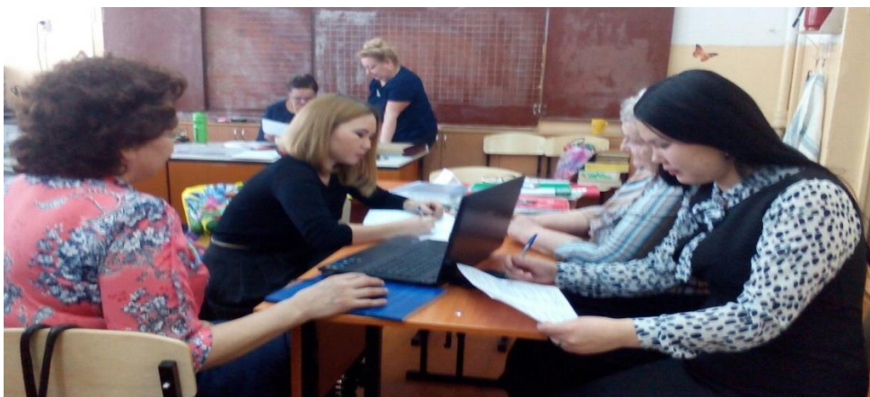
МБОУ Гимназия №9 г. Кызыла