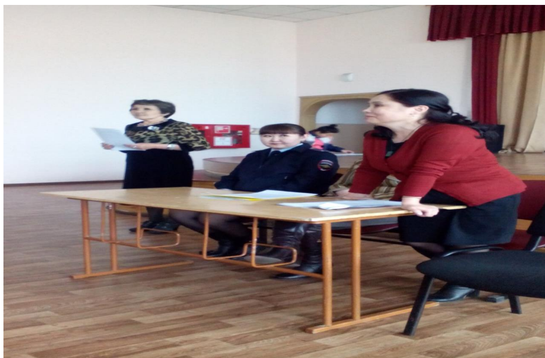
Опекуны МБОУ СОШ №3 г. Кызыла

16 апреля 2015 г. приняли участие на общешкольном собрании для опекунов в МБОУ СОШ №3 г. Кызыла с лекцией-информацией по теме «Психологические особенности и школьные проблемы опекаемых детей и приемных детей». Активизирована работа с приемными семьями, чтобы сформировать готовность для получения психологической помощи, убеждая их в необходимости такой работы, чтобы помочь ребенку успешно социализироваться в обществе. На сегодня основной упор школьные психологи ставят на нейтрализацию неблагополучия, разрабатывают индивидуальной программы сопровождения, устанавливают более тесные отношения с органами опеки.